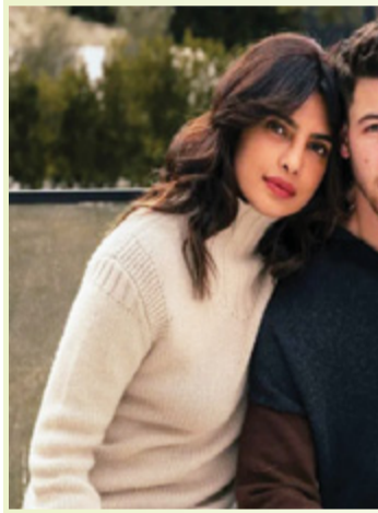
प्रियंका चोपड़ा और निक जोनस

प्रियंका ने अपने इस वीडियो में एकेडमी को टैग करते हुए कैप्शन में लिखा, "कोई चांस है कि मैं ऑस्कर नॉमिनेशंस की अनाउंसमेंट अकेले कर सकती हूँ? मजाक कर रही हूँ, लव यू निक जोनस। सोमवार को ऑस्कर नॉमिनेशंस की अनाउंसमेंट करने के लिए हम बहुत एक्साइटेड हैं। ऑस्कर नॉमिनेशंस द एकेडमी के सभी डिजिटल प्लेटफॉर्म पर 15 मार्च को सुबह 5:19 बजे से लाइव देखें।" यह पहली बार है, जब कोई कपल एकेडमी अवॉर्ड्स नॉमिनेशंस की अनाउंसमेंट करेगा।